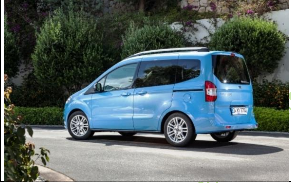
Ford Tourneo Courier (2014)