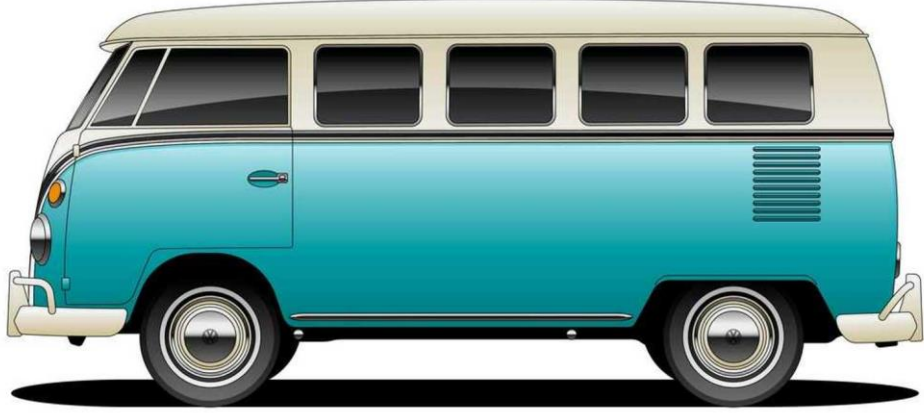
VOLKSWAGEN TYPE 2 (1950 - 1967)

Efsanevi model yollara ilk 1950 yılında çıktı ve o zamanlar kimse bu aracın ileride ne kadar popüler olacağını tahmin bile edemiyordu. Arkaya konumlanan 1.1 litrelik dört silindiri Boxer hava soğutmalıydı ve 24 bg güç üretebiliyordu fakat 1960'lara gelindiğinde hacim 1.5 litreye çıkarken güç de 54 bg'e ulaşmıştı. Almanya'da aracın imalatı 1967 yılında durdu fakat Brezilya, T1'in elden geçirilmiş versiyonlarını 1996 yılına kadar satmaya devam etti.