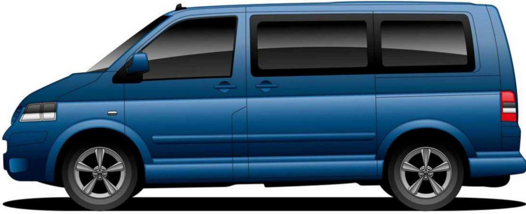
VOLKSWAGEN TYPE 2 (2003 - 2015)

Artık küçük ve güçsüz bir van olmaktan iyice çıkan Type 2, T5 jenerasyonu ile Avrupa'da orta boyutlu minibüse dönüştü ve T5 ile Volkswagen, yüksek ithalat vergileri dolayısıyla ABD pazarında bu modelle yer almaktan vazgeçti. Önden motorlu T5 benzinli ve dizel motorlarla donatılmıştı ve üst versiyonlarda 232 bg'e kadar varan gücünü ya ön tekerleklere ya da dört tekerleğe birden iletiyordu. T5 ile birlikte kamp versiyonu California adını aldı.